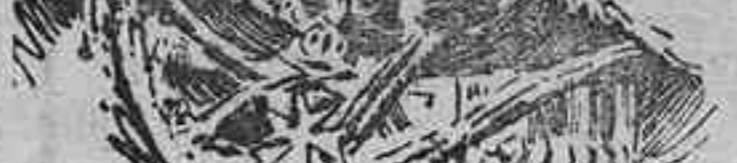
Gráfico del estrecho de los Dardanelos y de las costas Otomanas