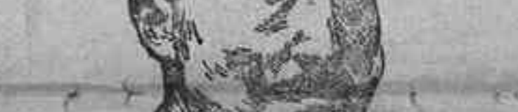
El general Pau comandante en jefe del ejército francés que opera desde la Lorena á Nancy.