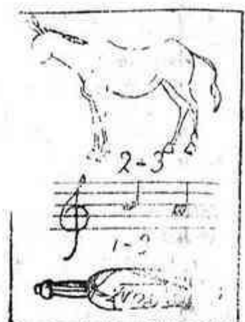
La solución, mañana.