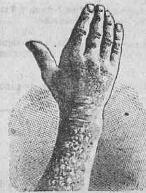
Antes de la curación.