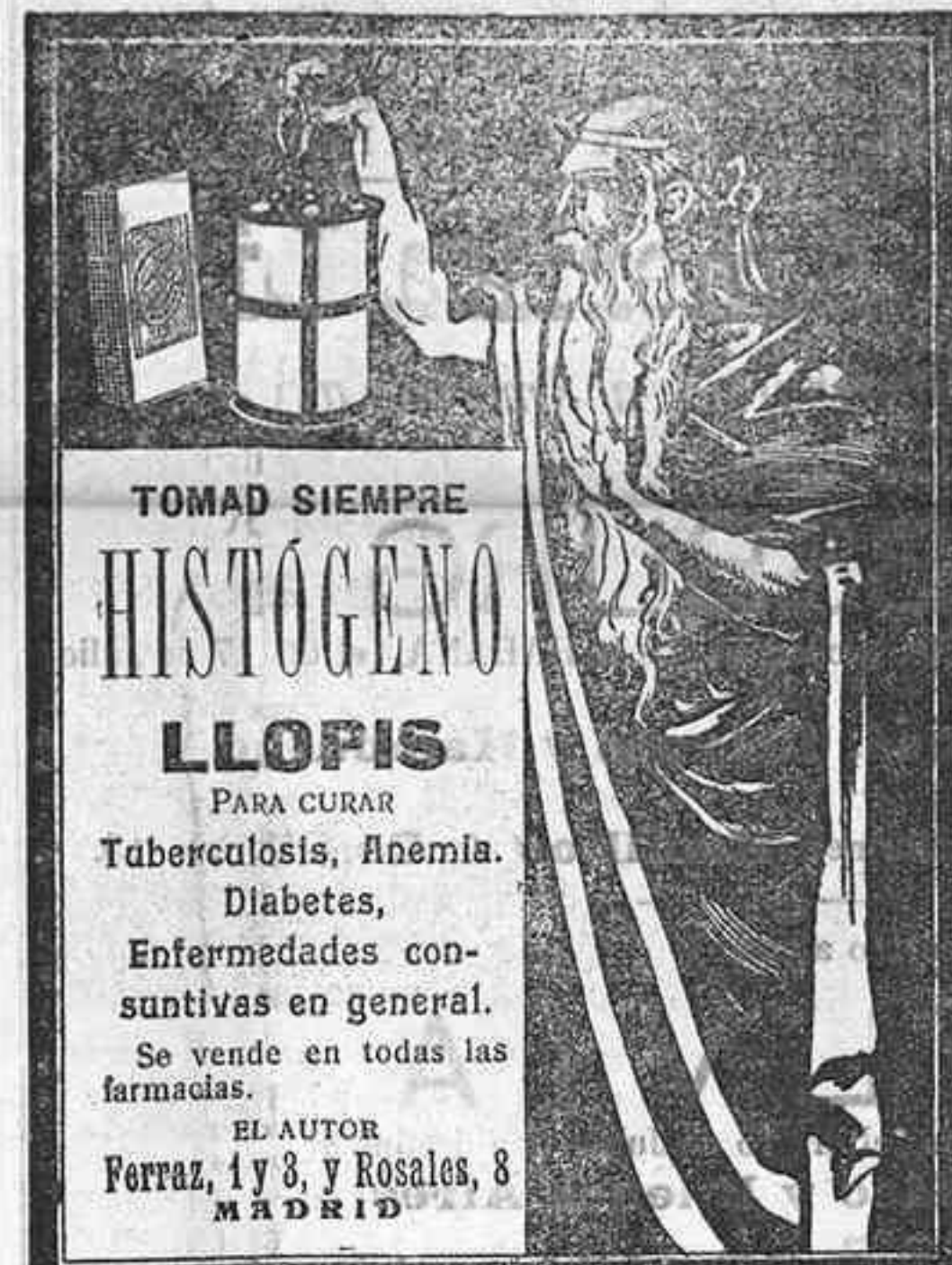
TOMAD SIEMPRE HISTOGENO LLOPIS PARA CURAR Tuberculosis, Anemia, Diabetes, Enfermedades consuntivas en general. Se vende en todas las farmacias. EL AUTOR Ferraz, 1 y 3, y Rosales, 8 MADRID

Las notas de carga deben presentarse en la Agencia el día antes de la salida de los vapores á las 12 de la mañana, no admitiéndose ningún conocimiento de carga después de esa fecha y hora.—Agente, Vinda é Hijos de Juan La-Roche.