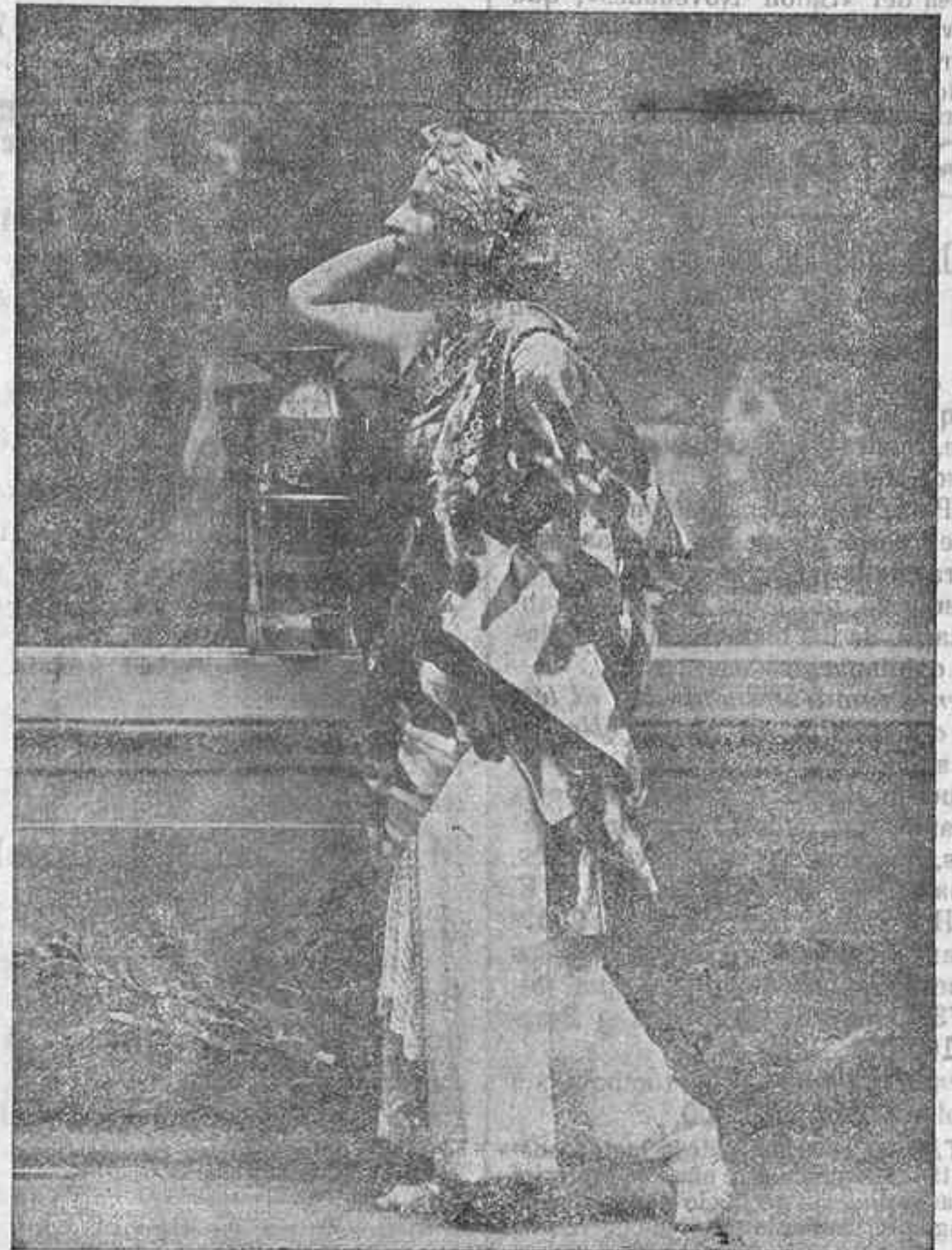
Esta noche hará su debut en este teatro, la grandiosa atracción mundial PALERMO-CHEFALO, que constituirá un ruidoso éxito.

Guerra para elevar temporalmente dicha cifra si lo considera necesario, dando en otros meses del año las licencias precisas para que los gastos consignados en el vigente presupuesto, ampliado con los que se concedieron con motivo de la creación de la Comandancia general de Larache y de la reorganización de la de Ceuta.»