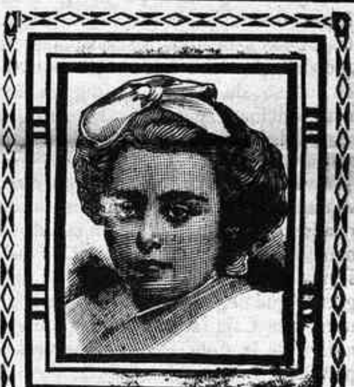
Barcelona, 11 Febrero 1909.

Catarro, coqueluche, Tos ferina y toda clase de TOS de los niños, se cura radical y rápidamente con el Anticarrar-Roselló, Farmacias y Droguerías.