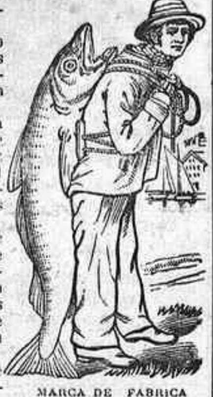
MARCA DE FABRICA