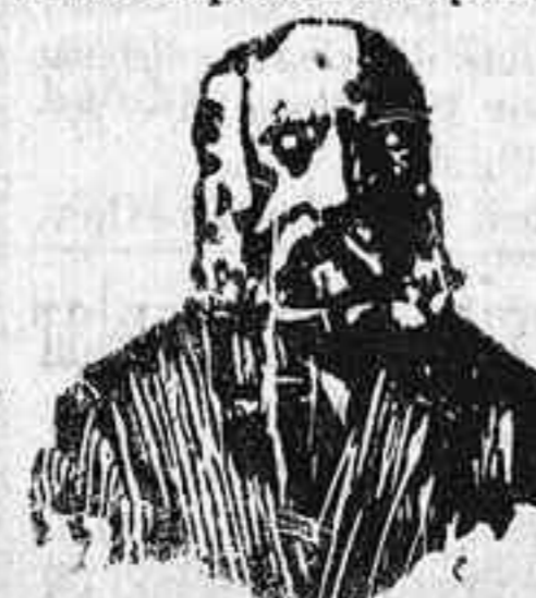
A. Charles Lambert—París.

Descubrimiento importantísimo. El eminente doctor Charles Lambert, de París después de un profundo estudio sobre las enfermedades venéreas y sífilíticas ha encontrado el medio de curarlas radicalmente, no solo sin hacer uso del MERCURIO, sino que combate las enfermedades contraídas por el uso de dicha sustancia. El tratamiento es sencillísimo y las fórmulas son puramente vegetales, pues en su composición solo entran hierbas minerales de la India. Estas fórmulas las presenta en las formas siguientes: Píldoras Charles Lambert, que curan las purgaciones, estrecheces de la uretra, flujo blanco de la muger, y gota militar. La Inyección Charles Lambert, que debe de usarse al mismo tiempo que las píldoras para que la curación sea más radical y pronta. El Elixir Charles Lambert es un gran medicamento, eficazísimo para la completa destrucción de todo bacilo sífilítico. Con su uso se purifica la sangre impura, dejándola en su estado normal, libre de todo virus, dando salud é inmunidad para evitar la reproducción de tan terrible enfermedad. Este Elixir debe de tomarse como complemento del tratamiento, una vez que los efectos, ó sea la purgación, haya desaparecido. Precio de las Píldoras, pesetas 4'50. La Inyección, pesetas 3'80 y el Elixir 3'80. De venta en Santa Cruz de Tenerife (Canarias), en la farmacia de Serra, calle del Castillo número 7. Para cualquier duda que se presente, consúltese por escrito al inventor, calle Balmes, número 106, Barcelona.