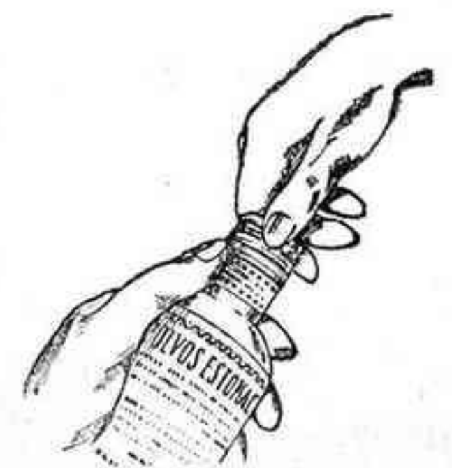
Figura núm. 4

Por consiguiente, todo frasco que no lleve las cápsulas cuyas características y grabados insertamos, para mayor conocimiento del público, debe ser rechazado, pues en este caso se trataría de una FALSIFICACION. Asimismo rechace el SERVETINAL vendido a granel, pues también es FALSO.