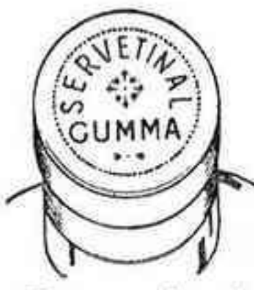
Figura núm. 1

Esta cápsula es plateada por los lados y granate en su parte superior, con una inscripción en relieve formada por el mismo metal de la cápsula, que dice "SERVETINAL GUMMA"; la palabra SERVETINAL de forma circular y la palabra GUMMA recta, debajo de la que dice SERVETINAL. Véase figura número 1.