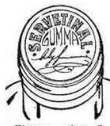
Figura núm. 2

Esta cápsula es totalmente plateada, o sea del mismo color natural del estaño; en su parte plana superior, o cabeza, ostenta una inscripción en relieve formada con tinta de color encarnada, que dice «SERVETINAL GUMMA», y debajo de esta inscripción la firma del autor. Véase figura número 2.