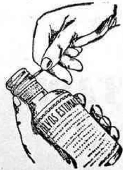
Figura núm. 3

En su parte lateral, adaptada al cuello de la botella, se ha practicado un corte con dos puntas, tírese por cualquiera de ellas y entonces queda la cápsula convertida automáticamente en un tapón de rosca. Véase figuras números 3 y 4.