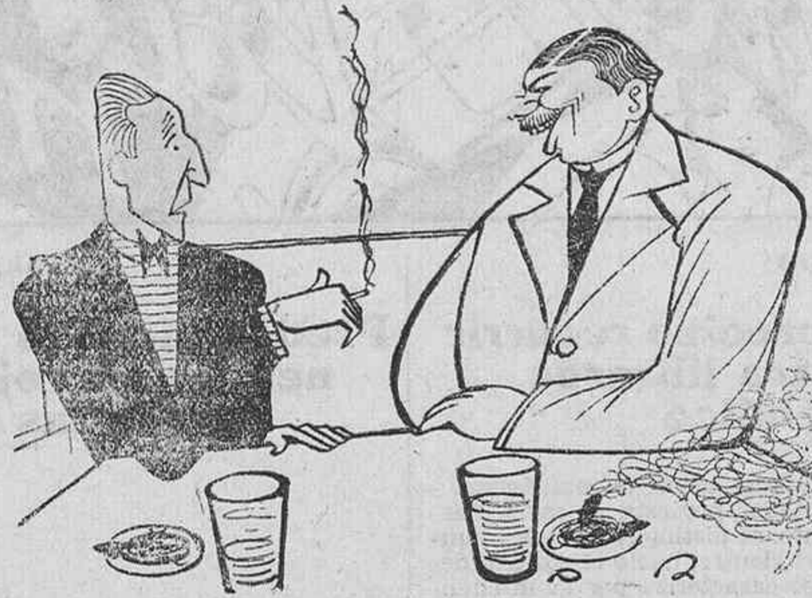
FILOSOFIA DE BEBEDORES

El plátano es de todos los productos alimenticias el más prolífico, pues se reproduce cuarenta y cuatro veces más que la patata y ciento veintitres más que el trigo.