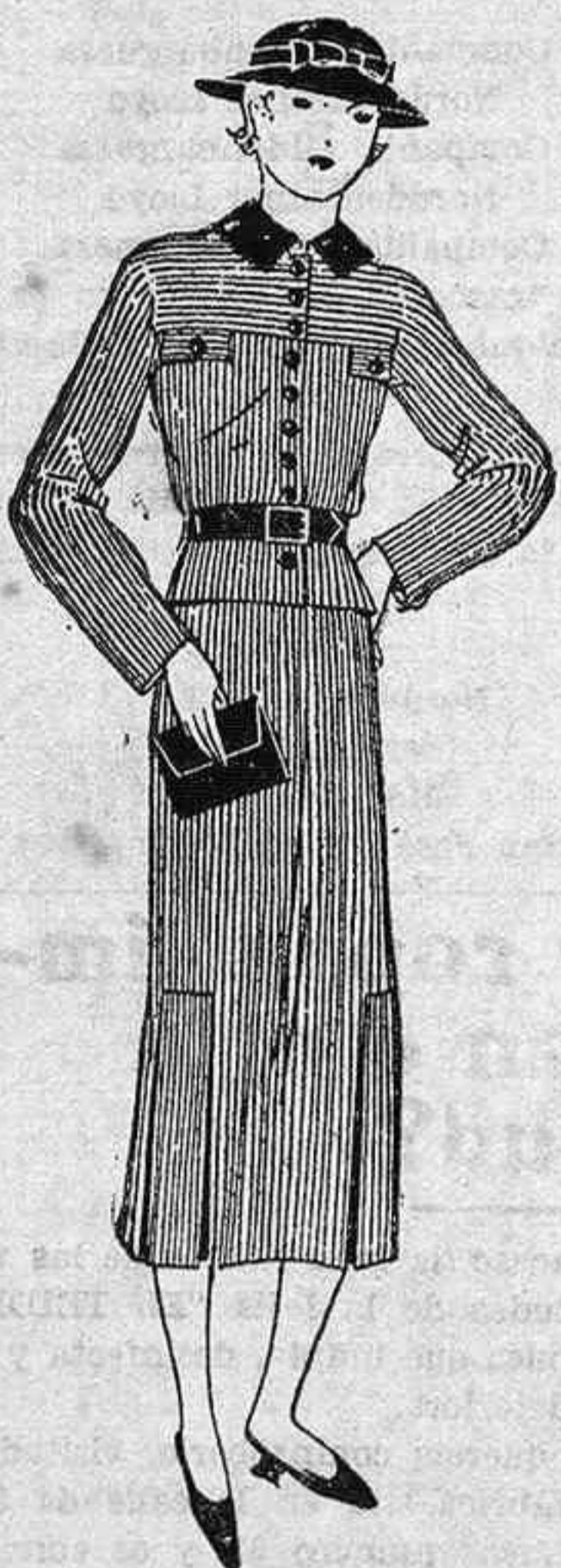
TRAJE PARA JOVENCITA

CASA CENTRICA, moderna, once dormitorios, dos comedores, dos cocinas, dos cuartos de baño, dos patios, pudiendo servir uno de garage, se vende.