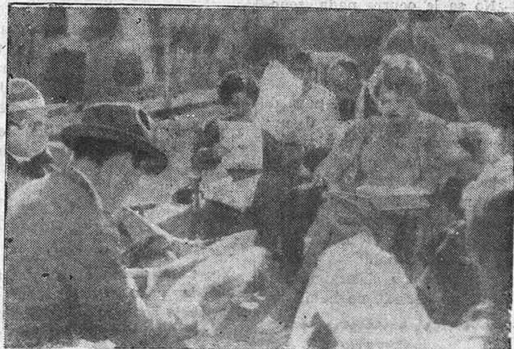
UNA HORA DE DESCANSO

Al terminar, pidió a los oficiales que se dirigieran a la juventud para decirle: "¡Arriba los corazones! No esperad la edad de veinte años para haceros fuertes, pues la patria os llama."