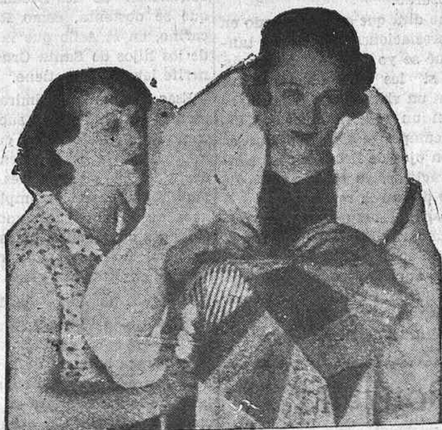
LOS FETICHES EN HOLLYWOOD

—Yo creía que Inglaterra no toleraba a los marinos piratas.