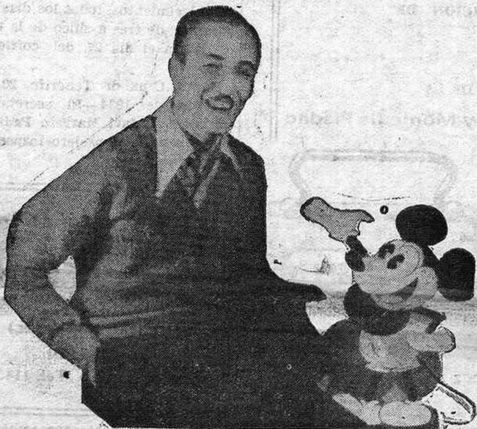
El afortunado dibujante americano Walt Disney, papá de ese regocijante monigote que todos conocéis por el nombre de Mickey, se deja posar por el fotógrafo, acompañado de su "hijo".