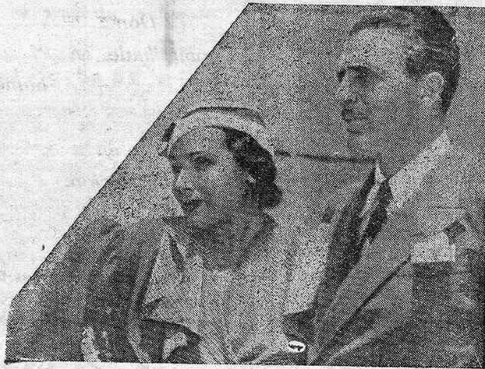
Una temporada en silencio, sin manchar el celuloide, ha servido para que Dolores del Río se incorpore a la actividad de los estudios y vuelva a tomar parte en la impresión de films. En la foto, le acompaña su marido, Gedric Gibbons, director de escena.