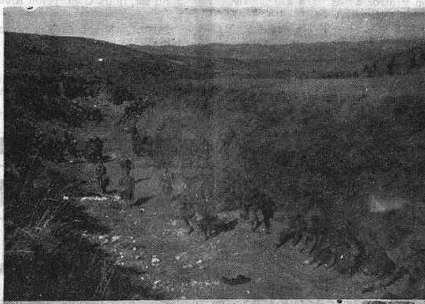
El segundo batallón expedicionario de Infantería de Tenerife, que tan valientemente se ha comportado haciéndose acreedor a la Medalla Militar, en el frente del Jarama. Esta fotografía lo presenta avanzando después de haber pasado el río

No solo estrategas de café, sino gente ecuaníme muy sensata caen en el vicio apenas se inician las operaciones de señalar caprichosamente objetivos, y, lo que es peor, precisar plazos para su consecución.