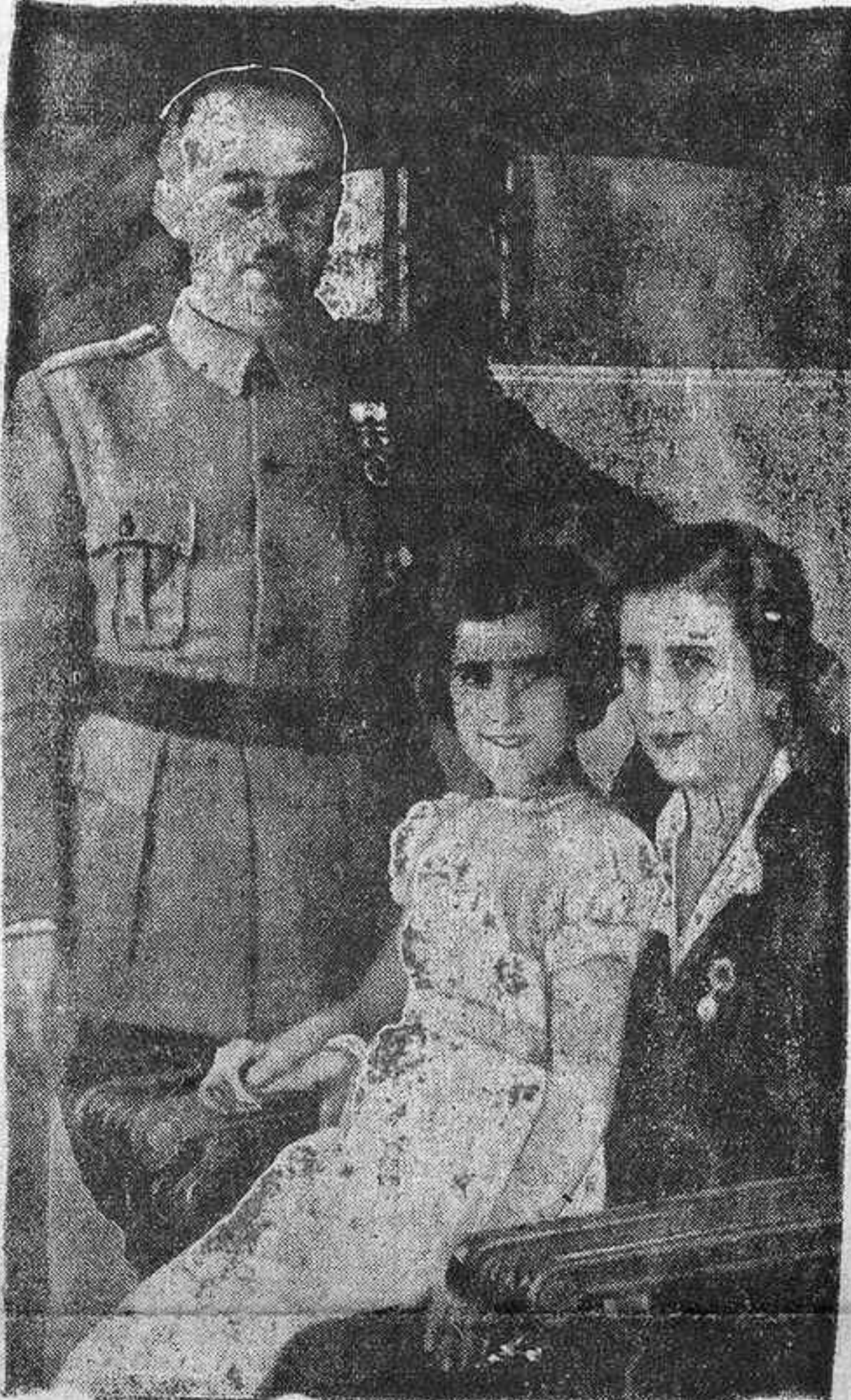
Un nuevo retrato del general Franco con su esposa y su hija. He aquí la amorosa y atrayente trinidad española en que están representados los valores esenciales de la nueva España y fundadas todas nuestras esperanzas!

EJERCITO DEL SUR. —Sector de Andalucía.—Tiroteos sin importancia, habiéndose presentado 12 soldados con armamento.