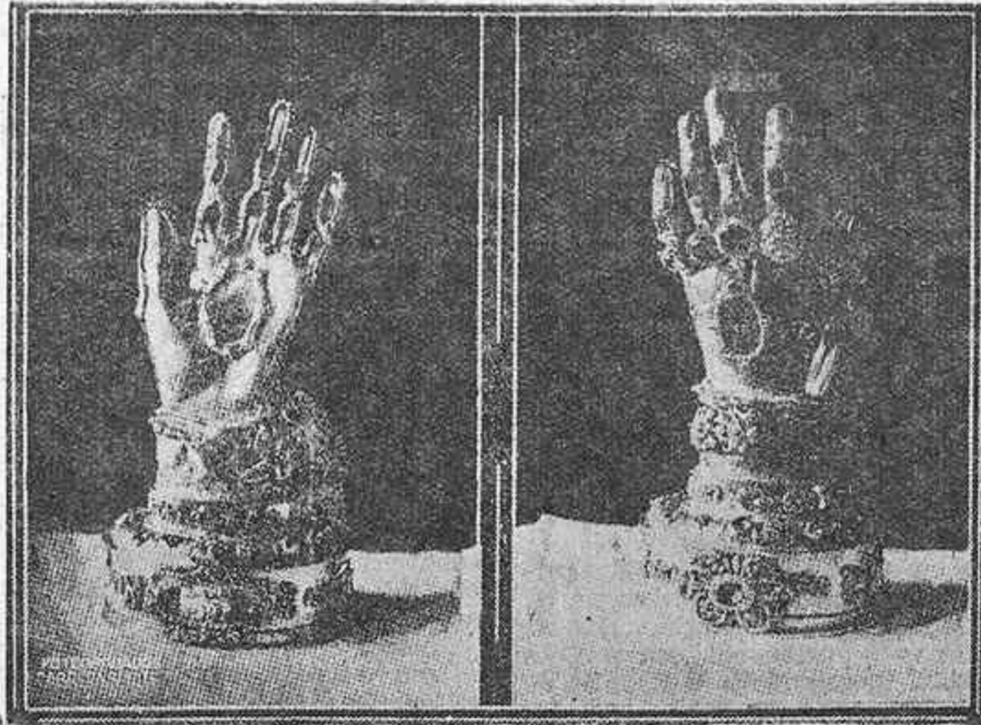
La mano sagrada de Santa Teresa de Jesús, que se hallaba en Ronda (Málaga) y que fué robada por el general rojo Villalba y recuperada al incautarse del equipaje de éste

SE ALQUILA EN EL LUGAR CONOCIDO POR "EL CARDONAL", EN TACO, UN HERMOSO CHALET RODEADO DE UNA EXTENSA FINCA. POSEE EL MÁS ACABADO Y LUSO SERVICIO HIGIENICO. DICHO CHALET SE HALLA EN LUGAR INMEDIATO AL CRUCE DE LA CARRETERA DEL ROSARIO CON LA GENERAL DEL SUR. PRECIO ECONOMICO. DARÁ RAZÓN, NORBERTO MORALES RUFINO. IGUALDAD, NUMERO 111