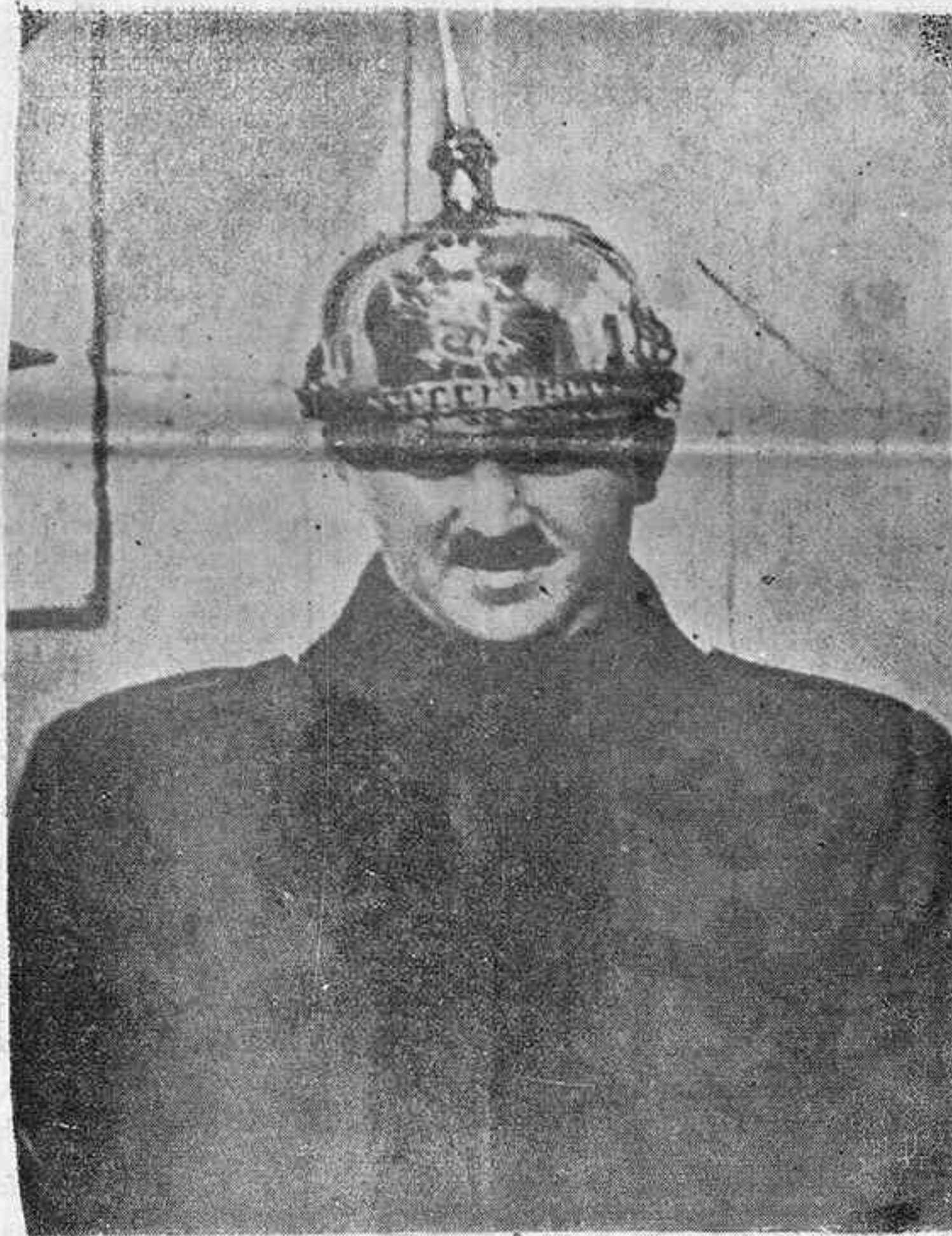
EL JEFE DEL ESTADO ESPAÑOL, GENERALISIMO FRANCO, CUYO GOBIERNO HA SIDO RECONOCIDO POR EL REICH Y EL IMPERIO ITALIANO. CON DICHO RECONOCIMIENTO, LA PRESTIGIOSA FIGURA DEL CAUDILLO ESPAÑOL ADQUIERE OFICIALMENTE EL RELIEVE INTERNACIONAL QUE DE HECHO YA GOZABA EN EL MUNDO. ¡VIVA ESPAÑA!

Señores: por España y por Franco... ¡Viva!