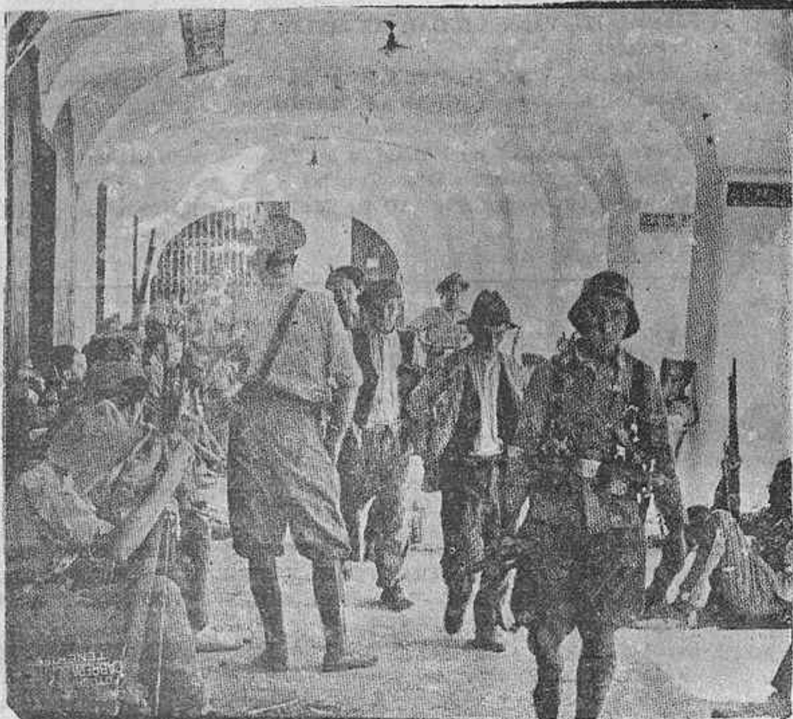
MERIDA.—SOLDADOS Y FALANGISTAS CUSTODIANDO A LOS CABECILLAS ROJOS, QUE SE RINDIERON AL LEGAR LAS TROPAS A AQUELLA CIUDAD.

cación moral; la educación integral, ese entrenamiento y adiestramiento moral; la educación integral, ese entrenamiento y adiestramiento de facultades y sentimientos, no podía llevarse a cabo en una escuela sin Dios; la obra general de la educación, del individuo, su educación integral, que dice la Pedagogía, quedaba incompleta, no podía llevarse a cabo dejando inculto un sentimiento innato en el corazón del hombre: el sentimiento religioso, el que había de brotar