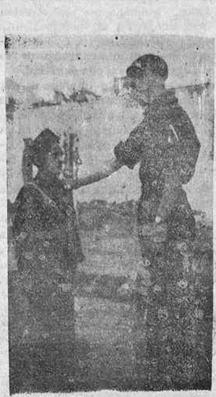
La leva fascista. He aquí una "foto", que tiene todo el valor de un símbolo. La incorporación de las generaciones a la Patria.

nos la eficacia de la misma. Con una precisión de poeta, sus palabras brotan con fuerza torrencial, y lo que creíamos iba a ser una simple conversación, un cambio de impresiones, se convierte en una charla de alcance insospechado, en la que se pone de manifiesto su alta cultura, sus claros y concretos conceptos del esculptismo y su conocimiento del niño.