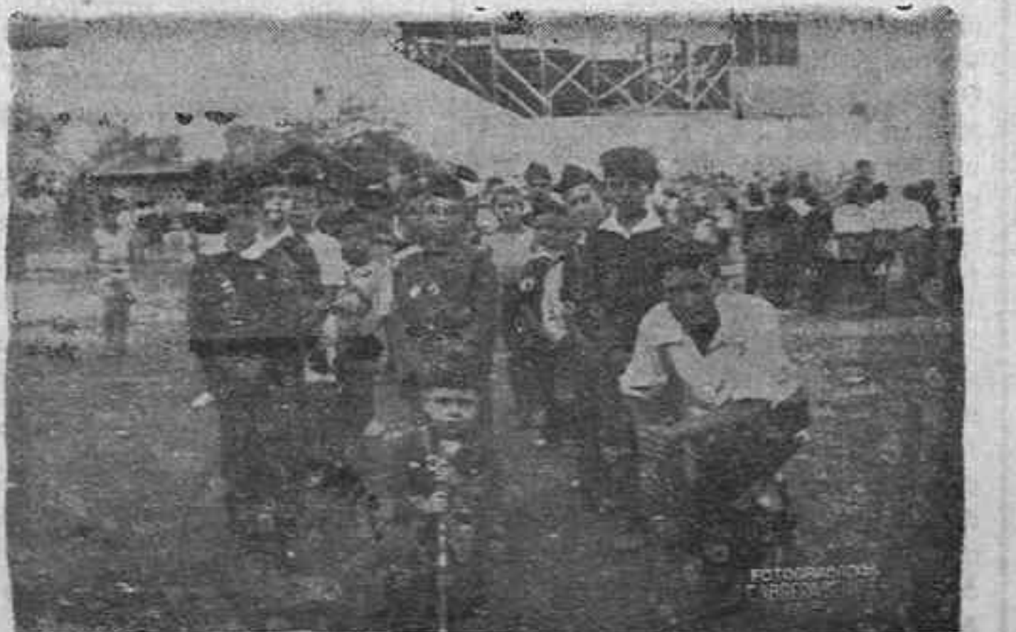
Un grupo de balillas hace alto para ser fotografiado. Momentos antes, con sus marchas de instrucción, trezaban ágilmente los caminos trillados de la España nueva.