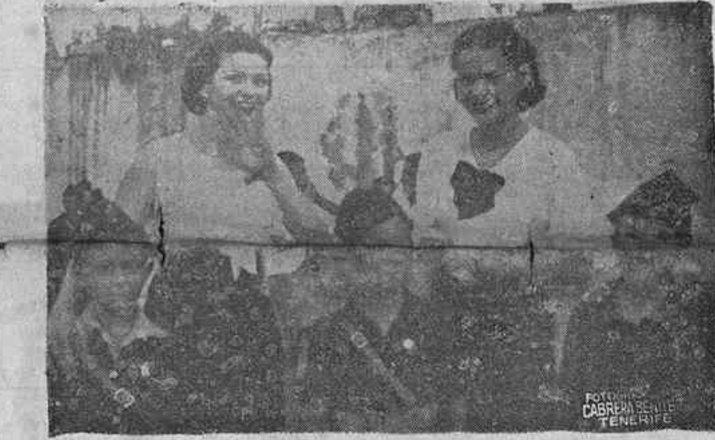
La mujer tinerfeña, españolísima siempre, pone una nota de belleza en el campo balilla.

Para tres personas mayores y de absoluta garantía y seriedad, se necesita una casa sola y preferible con algo de jardín. Pueden dirigirse, en Santa Cruz, Librería Católica, y en La Laguna, Droguería de don Daniel Píñero, Herradores (esquina a San Juan).