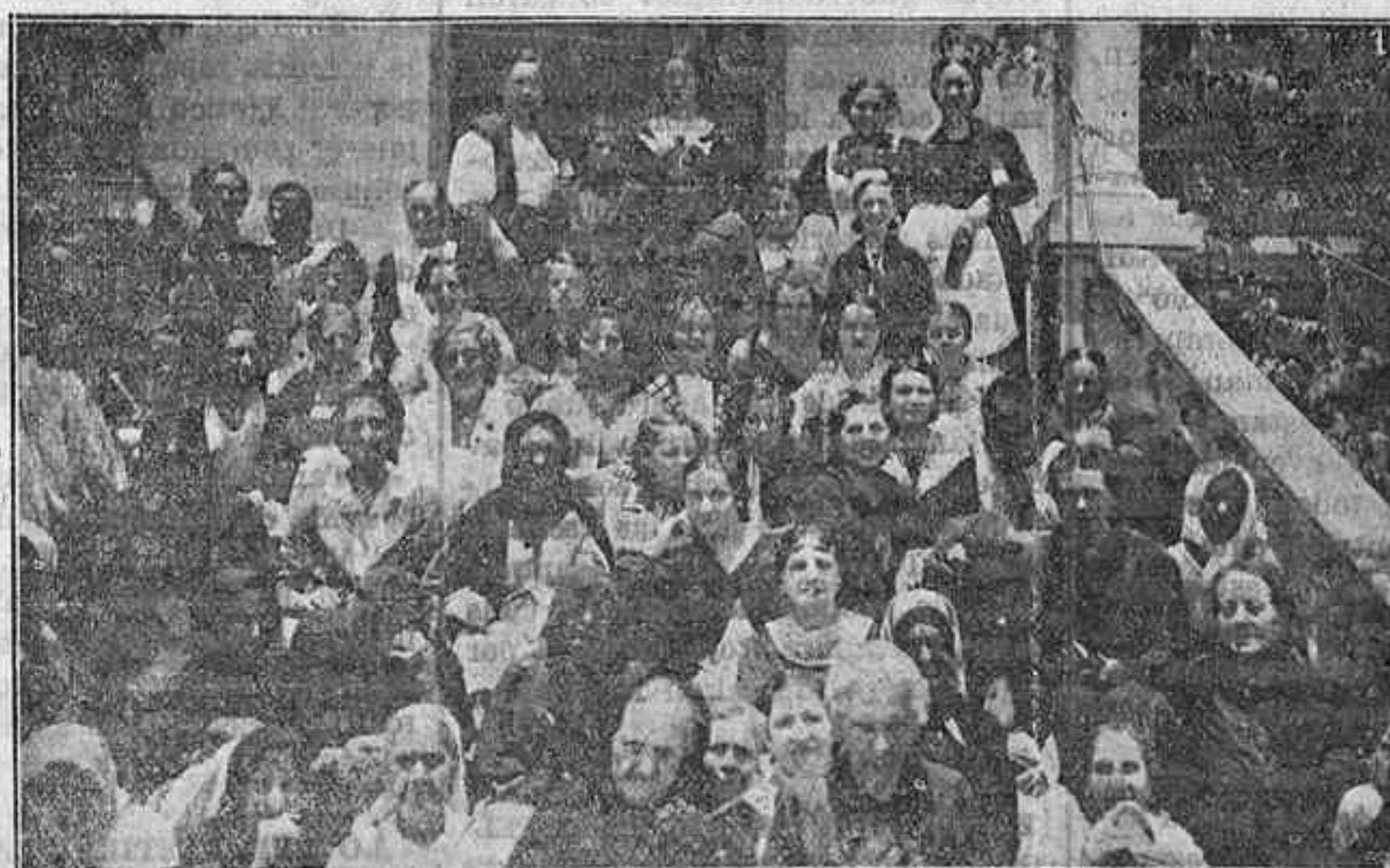
SOCIOS DE LA J. C. F. QUE DIERON RECIENTEMENTE UN ALMUERZO A LOS ACOGIDOS EN EL ASILO DE ANCIANOS DE ESTA CAPITAL.

Si no ingresas en la A. C., si no trabajas en la Acción Católica, medida que para tu desgracia, tendrás