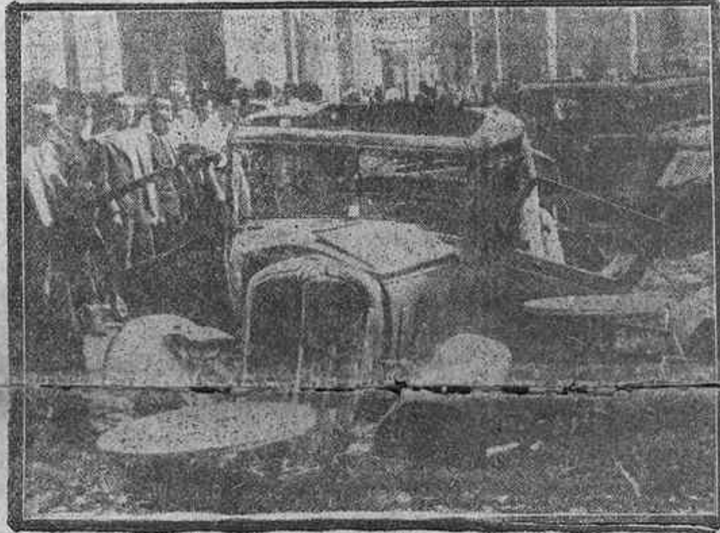
BARCELONA.—Autos, muebles y enseres en la Plaza de... destrozados por las milicias rojas de la Ciudad Condal

Se tiene conocimiento de que en Barcelona el número de franceses del Frente Popular que ya se encuentran en batalla es bastante elevado. También de que a dicha ciudad están llegando constantemente antifascistas, algunos de