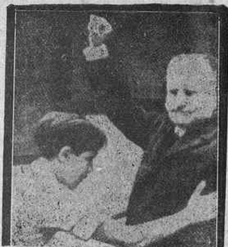
MADRID.—Niño comunista robando a un ciudadano bajo la amenaza de los fusiles rojos

Se reciben noticias confirmando que la aviación gubernamental de Madrid, solamente tiene petardos (Pasa a la página 8.ª)