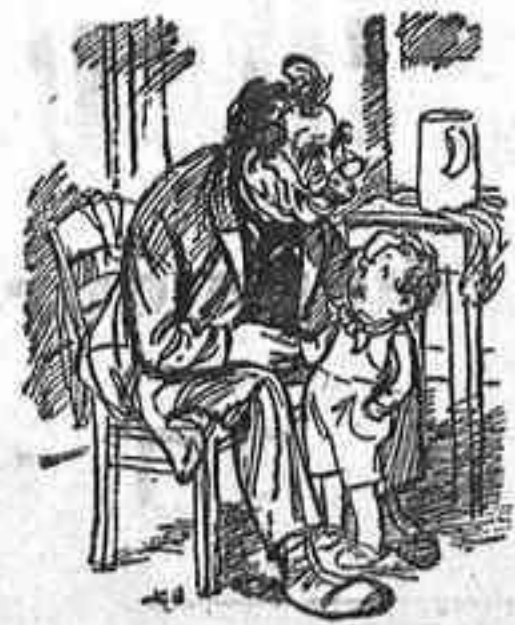
Los regalos de Reyes