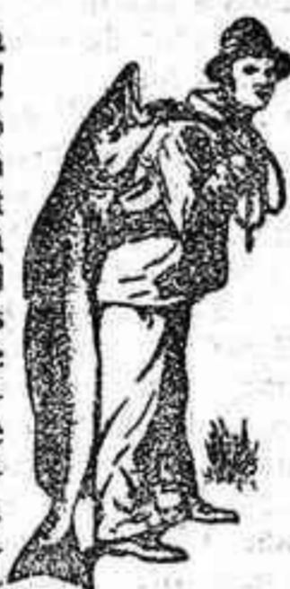
Marca de fábrica.

Los niños la piden a gritos! El aceite de hígado de bacalao usado en la Emulsión Scott es tan puro y resulta tan agradable al paladar que, la más tierna criatura puede tomarlo sin dificultad y sin peligro de perjudicar las funciones digestivas. Ninguna otra Emulsión contiene aceite de hígado de bacalao de esta calidad ni tiene sus propiedades curativas.