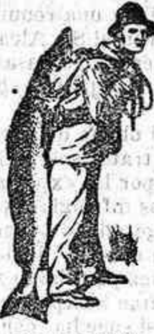
Marca de fábrica.

Es un contrasentido confiar la salud de los hijos a remedios de baja calidad cuando la Emulsión SCOTT no ha cesado de curar durante 40 años donde todo otro remedio ha resultado inútil.