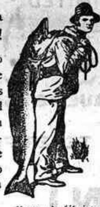
Marca de fábrica.

Es un contrasentido confiar la salud de los hijos a remedios de baja calidad cuando la Emulsión SCOTT no ha cesado de curar durante 40 años donde todo otro remedio ha resultado inútil.