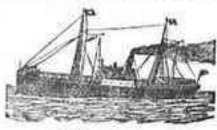
El magnífico vapor

LISTA DE LOS VAPORES que saldrán de Santa Cruz de Tenerife para los puertos que á continuación se expresan: