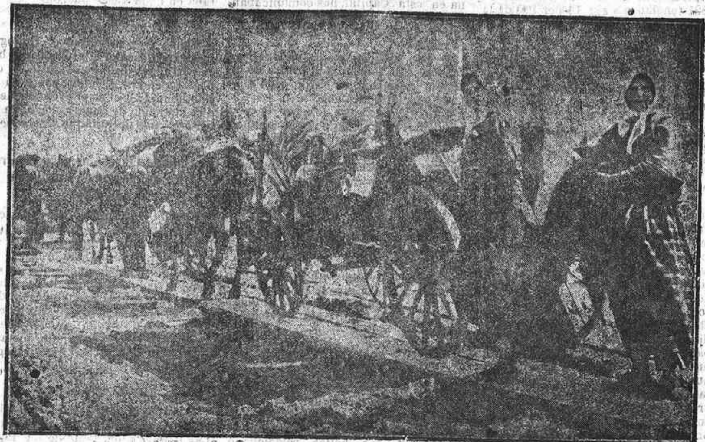
Una caravana de fugitivos polacos.

Háganse por un momento, todos estos señores, el pensamiento de que empezamos a vivir ahora, en política, libres de añejos pactos y componedores, que no hay caciques, que no hay representantes, que no hay nada de toda esa rémora que ahoga nuestra vida provincial y laboren por sí, ellos solos, sin pe-