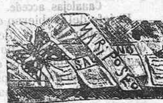
Carta de una maritornes, sirvienta de esta ciudad, para sí en Mariposo la quisiera publicar.

Este corresponde vitoreando á la Tuna Escolar. Por nuestra parte, la deseamos un feliz viaje.