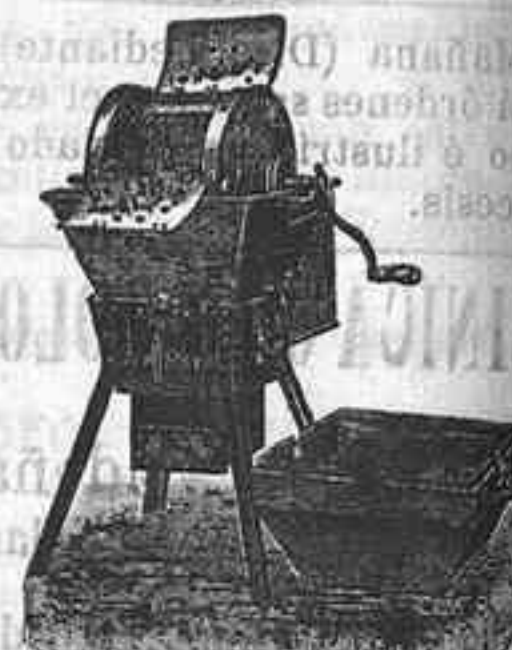
Máquina de lavar Todo Vapor

Util a todos: desde la familia más reducida hasta los más grandes establecimientos.