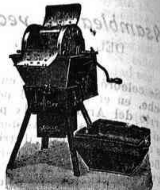
Máquina de lavar Todo Vapor

Útil á todos: desde la familia más reducida hasta los más grandes establecimientos.