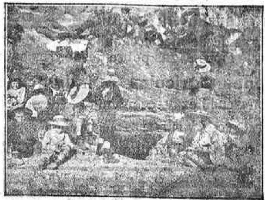
Los Alumnos del Colegio.—Un día de excursión

Este Centro es el mejor montado de la capital. A él concurren los niños de las familias más distinguidas. Es el único que no tiene alumnos de Facultad. El solo es el que tiene todo para la primera enseñanza. Es el que más profeso sus hijos.