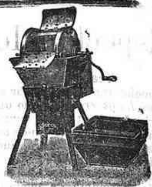
Máquina de lavar Todo Va or