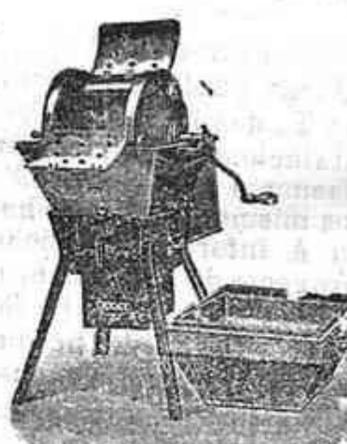
Máquina de lavar Teco 1090

Útil á todo: desde la familia más reducida hasta los más grandes establecimientos.