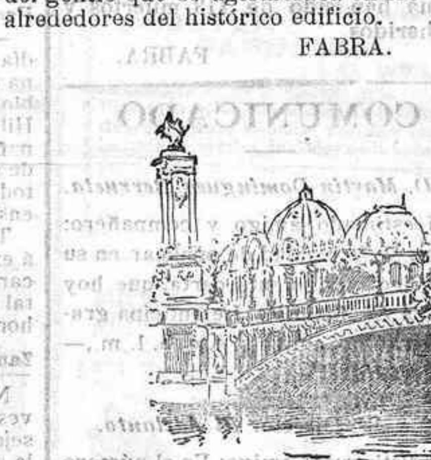
PUENTE DE ALEJANDRO III