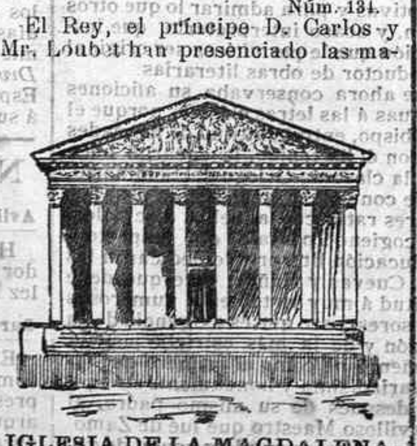
IGLESIA DE LA MAGDALENA