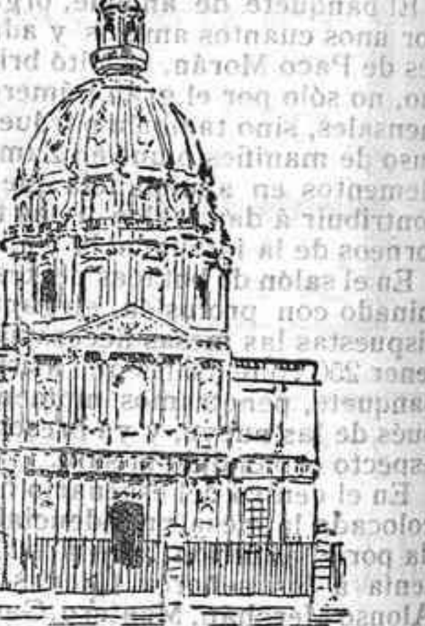
HOTEL DE INVALIDES