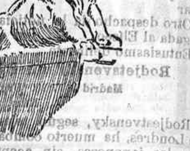
HOTEL DE INVALIDES

Después se dirigió al Panteón y la Iglesia de Notre Dame de París, donde admiró su arquitectura y magníficas joyas.