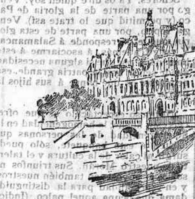
HOTEL DE VILLE Y LEON DE BELFOR

D. Alfonso pronunció su brindis en francés, entusiasmado á los comensales, que le aplaudieron francamente.