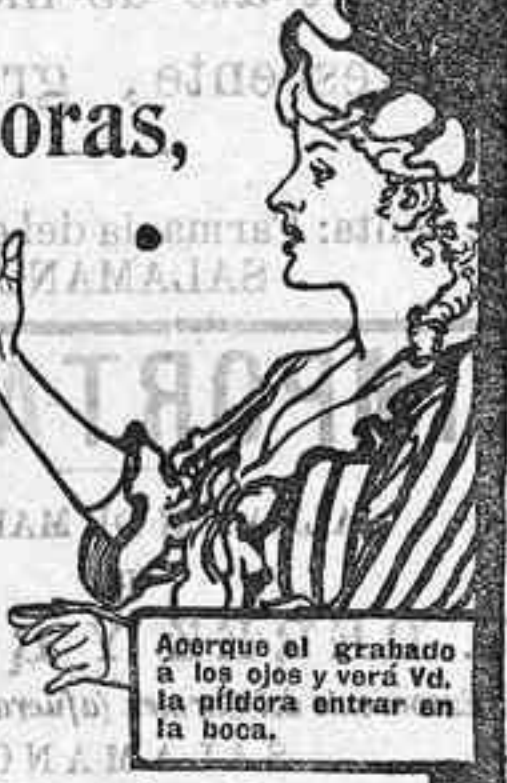
Asegure el grabado a los ojos y verá Vd. la píldora entrar en la boca.