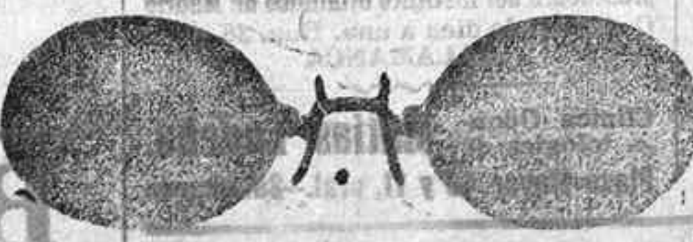
Este modelo, en níquel, 5 pesetas.

Plaza Mayor, 40 (acera de Correos), Salamanca. A pesar de la gran subida de la mayoría de los artículos, sigo vendiendo a los mismos precios. Gran surtido en relojes finos y corrientes, en ORO, DE SENORAY CABALLERO; relojes de plata, acero y níquel, marcas escogidas; despertadores de bolsillo con esteras Radio. RELOJ, ORO DE LEY, en correa, para caballero o señora, 40 pesetas; en níquel, 7.