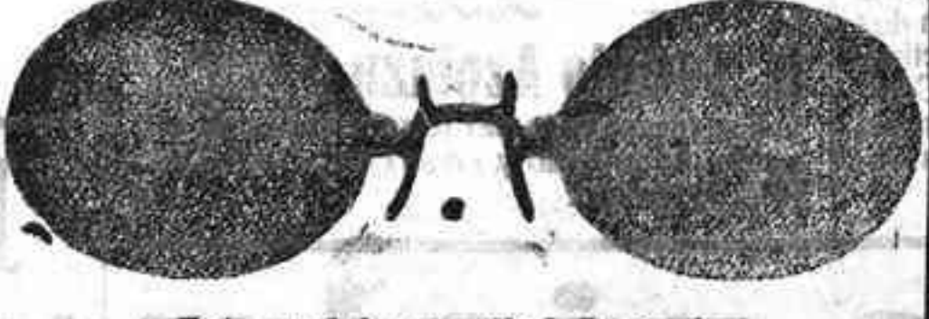
Este modelo, en níquel, 5 pesetas.