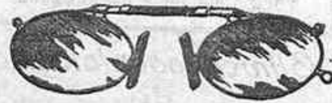
Lentes o Gafas de CRISTAL FOCA. 5 Pesetas.