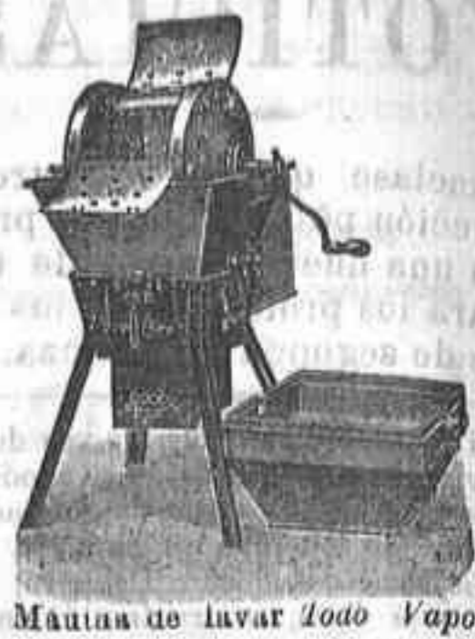
Máquina de lavar Todo Vapor

Útil á todos: desde la familia más reducida hasta los más grandes establecimientos.