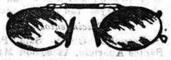
Lentes o Gatas de CRISTAL ROCA, 5 Pesetas.

SECCION DE RELOJERIA La casa que más surtido y novedades presenta, modelos nuevos cada ocho días. Gran surtido en marcas legítimas OMEGA, Longines, Juvenia, Waltham, en cajas de oro, plata, acero y níquel. Relojes extraplano desde SEIS pesetas. Reloj para campo y caza, marca garantizada. CURVOISIER, diferentes modelos a 18 pesetas. Despertadores, esfera luminosa, repeticiones Cronógrafo, etc. Re ojos de pared, infinidad de modelos ingleses en roble, caoba y nogal. Relojes de sobremesa y despertadores, 5 pesetas.