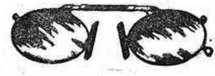
Lentes o Gatas de CRISTAL ROCA, 5 Pesetas.

Gemelos prismáticos, diferentes aumentos, de teatro, desde 10 pesetas. Imperfectos, brújulas, barómetros, barómetros y termómetro tallado, a 15 pesetas. La casa que más se ojea de torra puesto en la provincia y única para construcción de ruedas dentadas para relojes de pared. Se con truyen relojes imitación exacta a los INGLESES. PRECIOS SIN COMPETENCIA