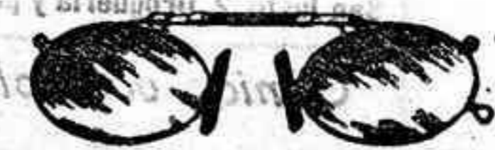
Lentes o Gatas de CRISTAL ROCA. 5 Pesetas.

GRAN RELOJERIA Y OPTICA DE Antonio Ferreira P. Mayor, 40 (acera de Correos) SALAMANCA.