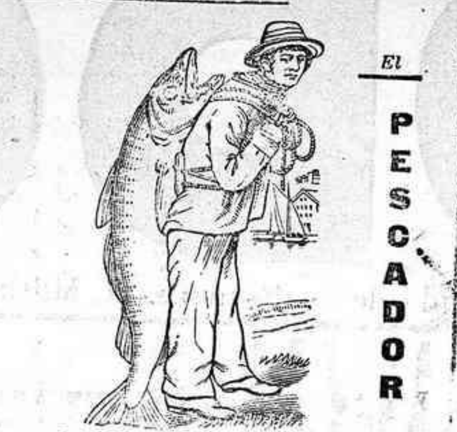
Islas de Lofoden (Noruega) 1902.

Desde muchos años yo pesco para ustedes el mejor bacalao que anda en estos mares, y este bacalao de Lofoden es el mejor del mundo. De estos bacalaoes yo pesco con anzuelos y larzo curriedo, yo reservo para Vds. exclusivamente los de primera calidad. En todos los años que trabajo para Vds. nunca les he dado un pescado de calidad inferior. Esta es la razón de la extraordinaria calidad curativa del aceite que yo extraigo para Vds. de los filetes de esos pescados y siempre ha sido de primera calidad de la producción noruega, que es la más superior del mundo. Si el hijo de pueblo español quiere cosas de primera y no de inferior calidad, pedirá siempre la Emulsión Scott que lleva en el envoltorio la etiqueta que representa un gran bacalao de Lofoden á costas de S. U. S. E. EL PESCADOR.