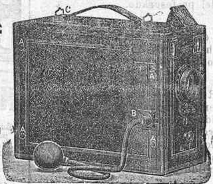
Detective de 6 h por 9 de 6 placas a 9'50

LE KINORA MARAVILLA DE LA EXPOSICIÓN DEL 900