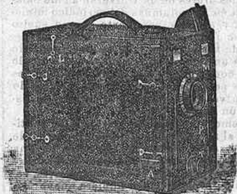
Le Ganga, Le Lindo cosmos