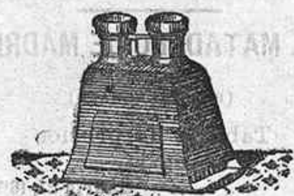
Stereoscopio y doce vistas exposición de 1900, 12'50 PTS.

PLACAS Y PAPELES DE LUMIERE, GUILLÉNINOT, ST. CLAIR, LIESEGANG, AMERICANAS Y ALEMANAS