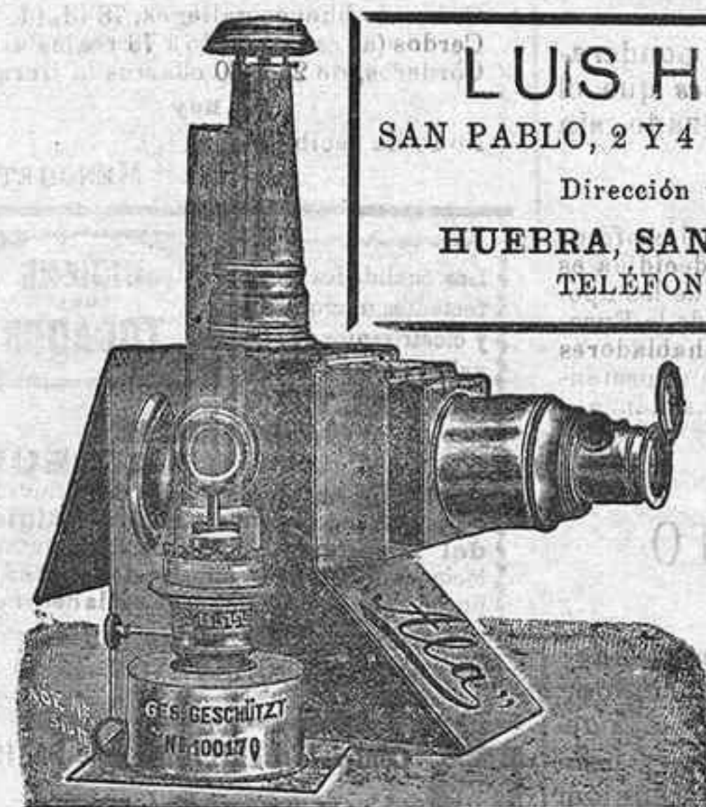
Aparatos de proyección completos, desde 120 pts.

LUIS HUEBRA SAN PABLO, 2 Y 4 SALAMANCA Dirección telefónica: HUEBRA, SAN PABLO, 2 Y 4 TELÉFONOS, 88 Y 41