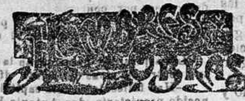
DON PEDRO EGAÑA

No importa menos conocer el límite de lo posible que la certidumbre de las buenas intenciones, y vale más pecar de corto en lo que se ejecuta que de excesivo y ligero en la promesa. Los educadores del espíritu público no tendrían de ese modo ocasión de advertir cómo actúa la común decepción de gran disolvente para los hechos ofrecidos y las reputaciones sospechadas.