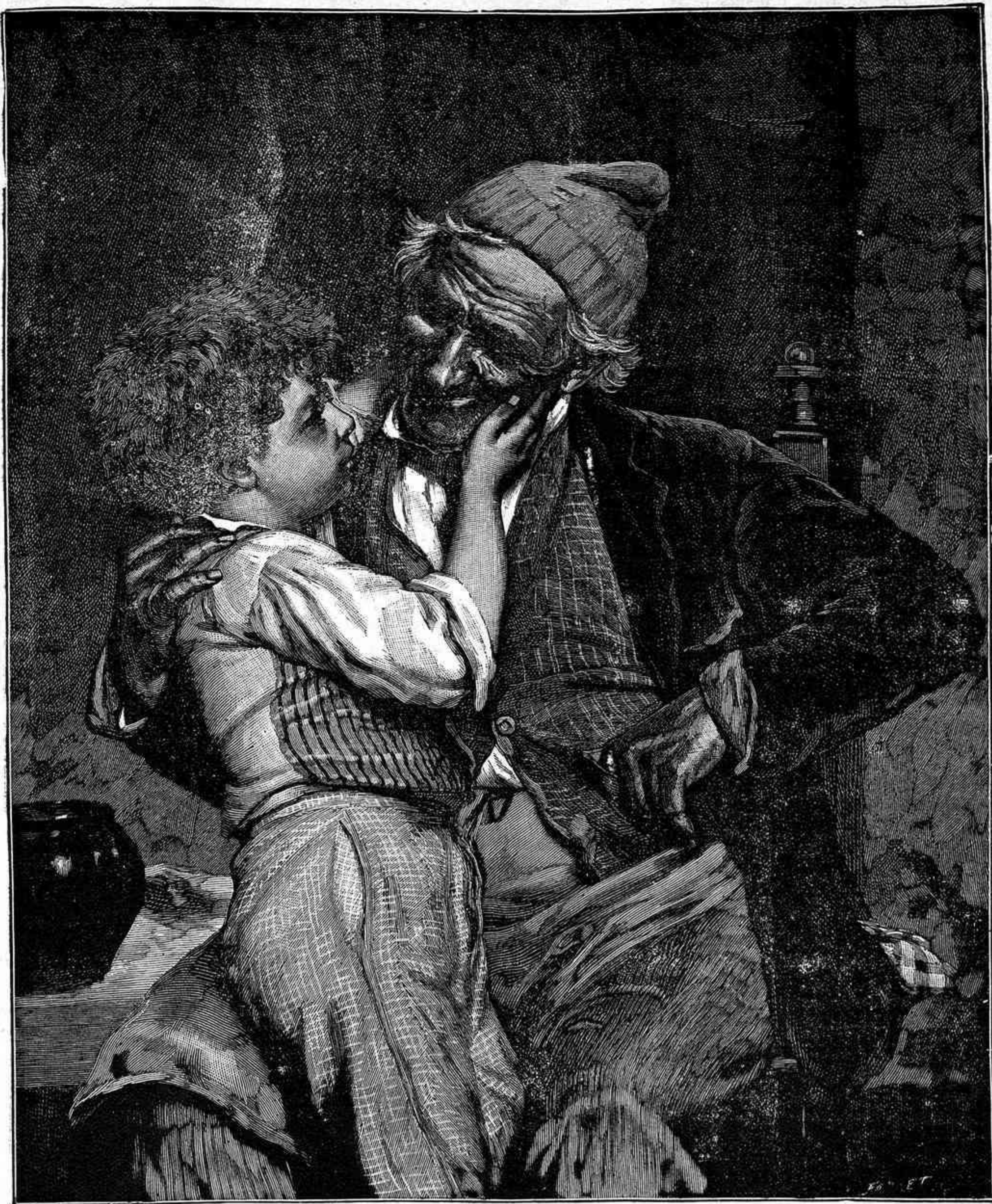
Dame un centimito, abuelo.