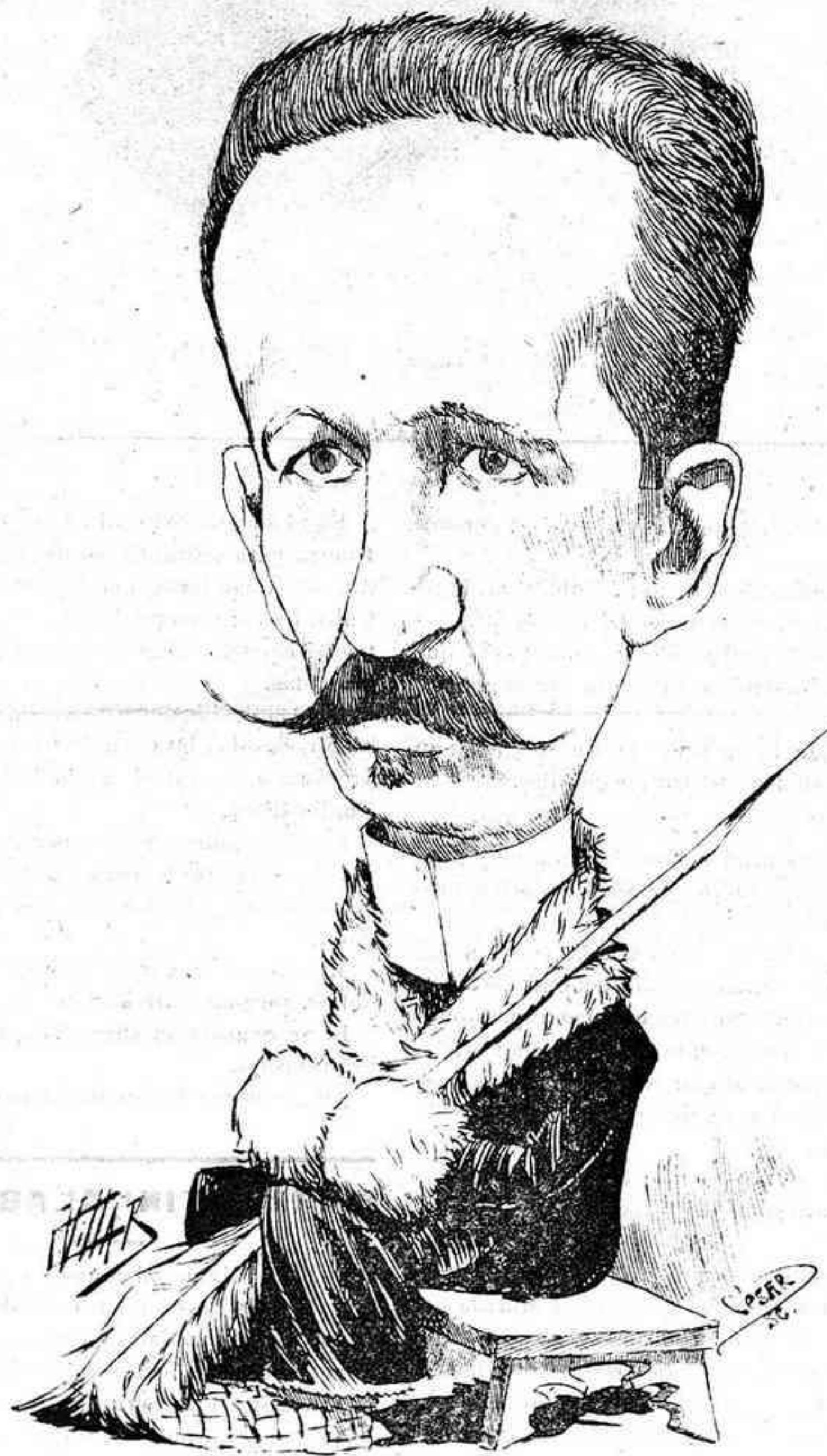
Es excelente escritor que no tiene vanidad, y no hay crítico mejor en toda la cristiandad.

y á la medida nos ha enseñado el destino de la mujer, lo desconocíamos al grito de ¡viva la emancipación de la mujer ó de las señoras como quería una emancipadora amiga mía; se nos ha caído la venda que tantos siglos cubría nuestros ojos!