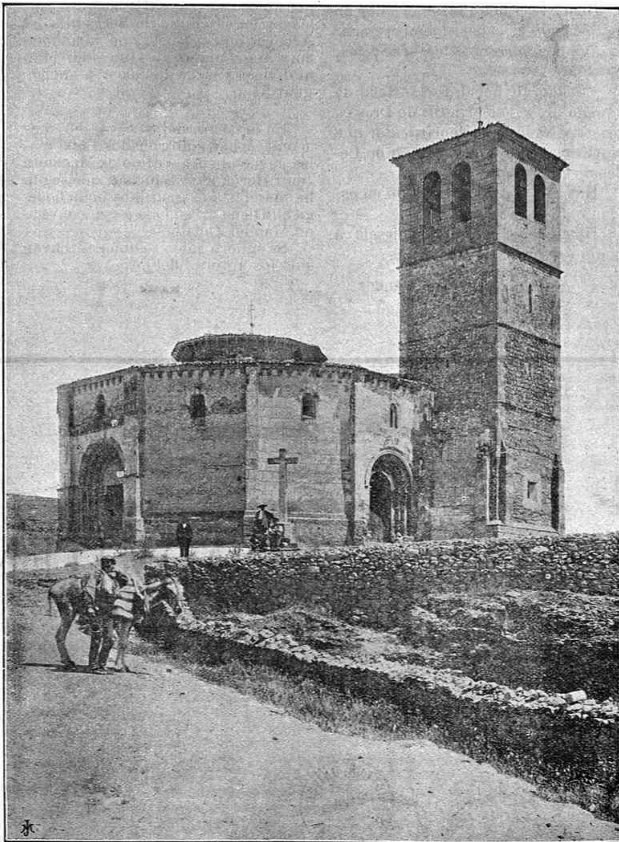
SEGOVIA—SANTA VERA CRUZ