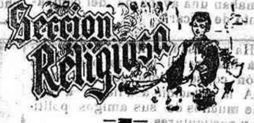
Exposición, rosario, letanía cantada y novena...