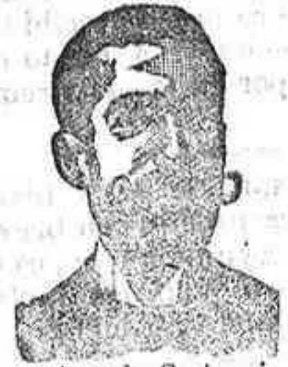
Angelo Costanzi Dip. 345, Barcelona

Depósito central del doctor ABRAS XIFRA, 10 Argensola—10, Farmacia, Madrid.—Véndese en Salamanca, en todas las farmacias y droguerías. En Filipinas: Ruberte y Guamis, Manila.